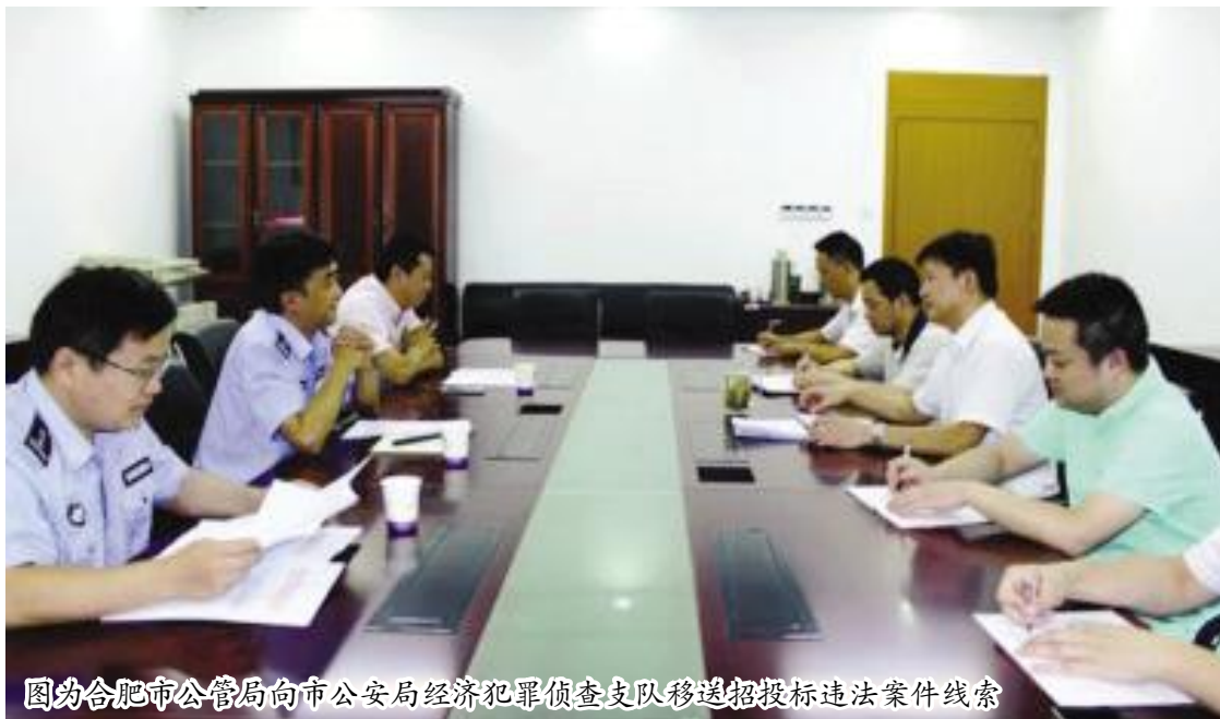
图为合肥市公管局向市公安局经济犯罪侦查支队移送招投标违法案件线索