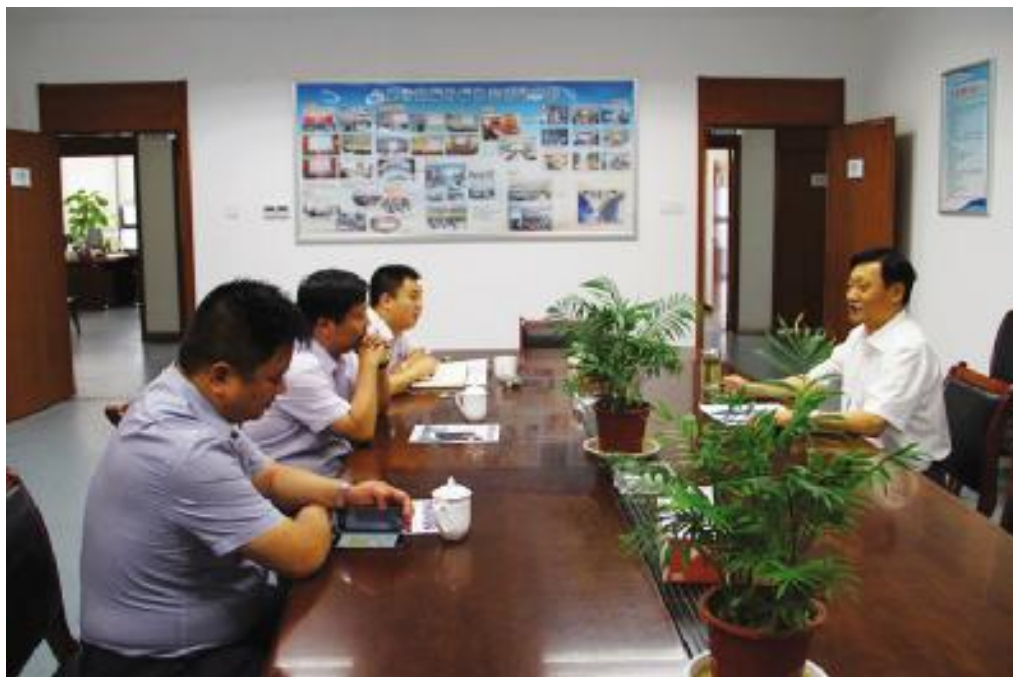
图为任总一行参观考察协会工作

本次会见由合肥市招标投标协会联系安排。会见前,任总一行首先来到协会参观考察并进行简短交流。