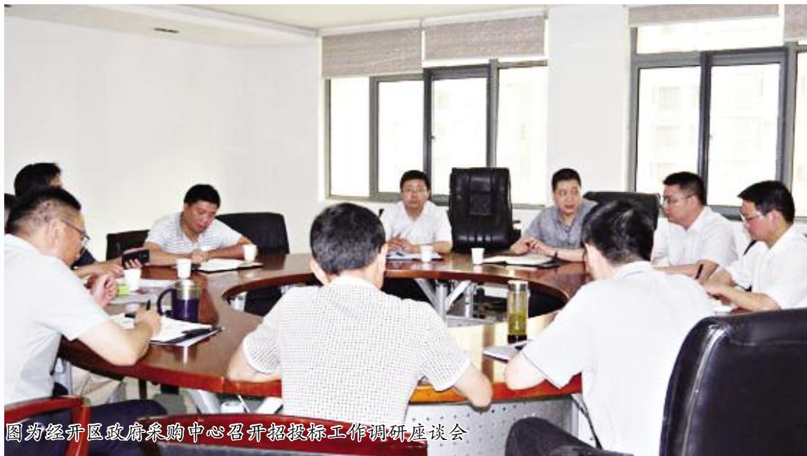
图为经开区政府采购中心召开招投标工作调研座谈会