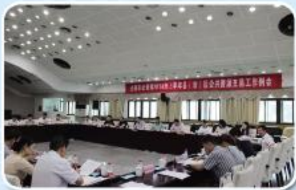
▲市公管局召开 2014 年上半年县（市）区公共资源交易工作例会