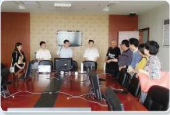
▲合肥市招标投标协会组团赴湖北、宜昌市公共资源交易中心考察