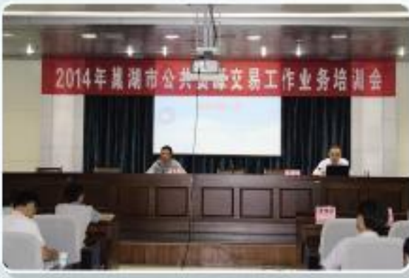
▲市公管局联合市招投标协会赴巢湖开展送训上门活动