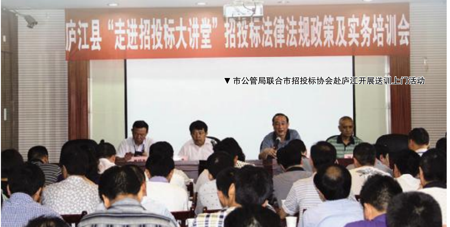
▼市公管局联合市招投标协会赴庐江开展送训上门活动