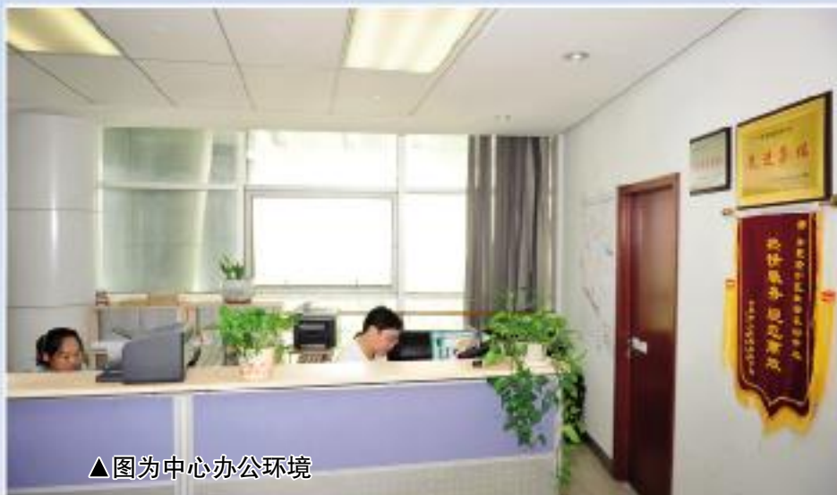
▲图为中心办公环境