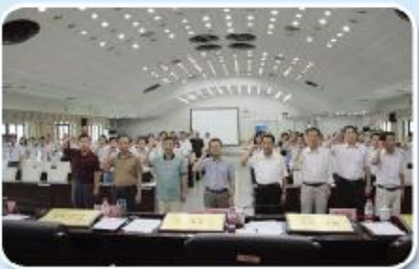
▲市公管局召开庆祝建党 93 周年“七一”表彰暨党课报告会