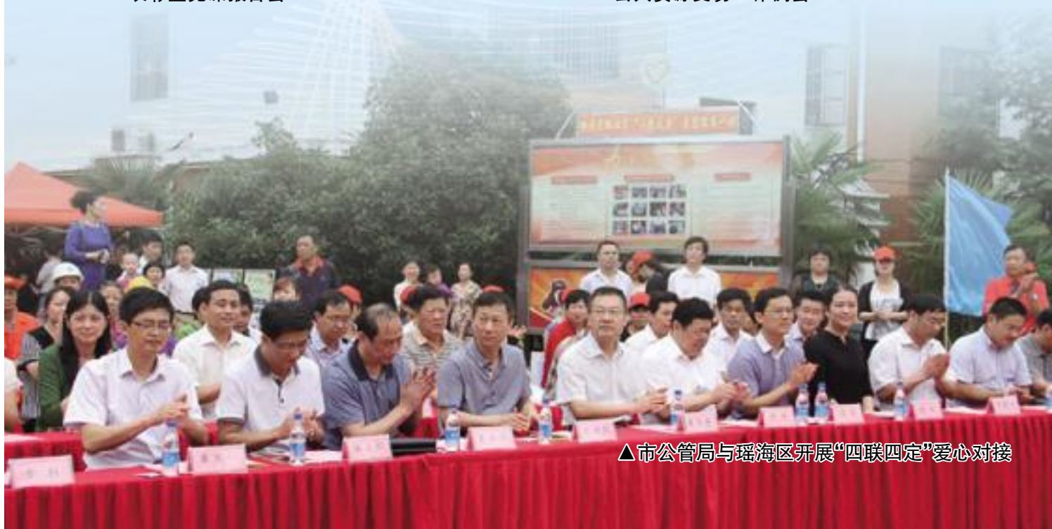
▲市公管局与瑶海区开展“四联四定”爱心对接