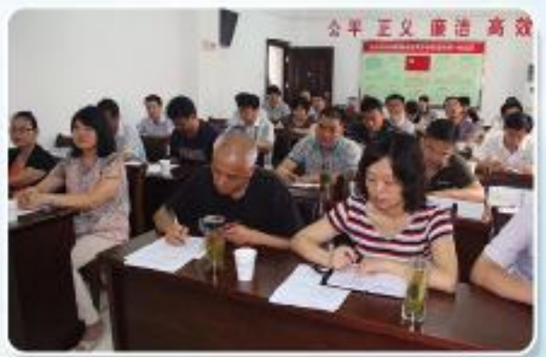
▲市公管局联合市招投标协会赴肥西开展送训上门活动