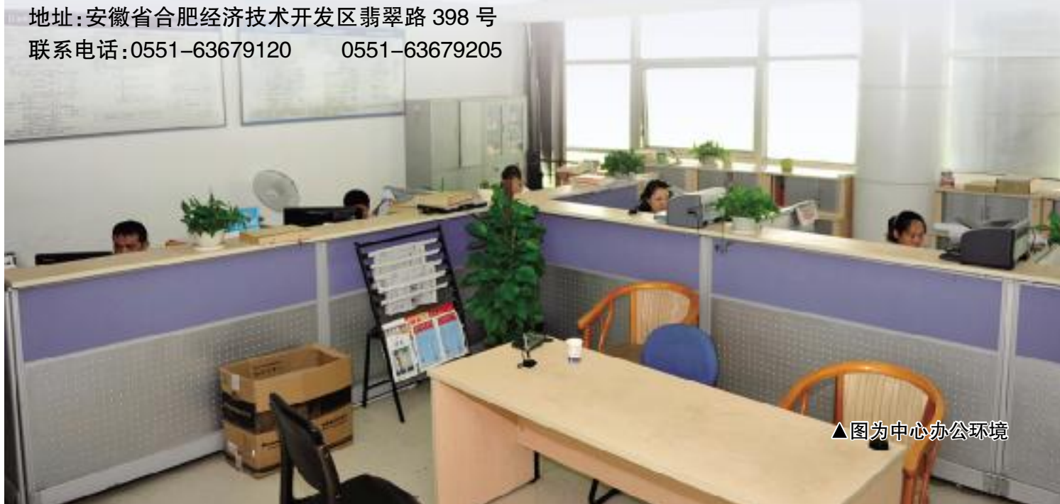
▲图为中心办公环境