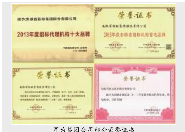
图为集团公司部分荣誉证书